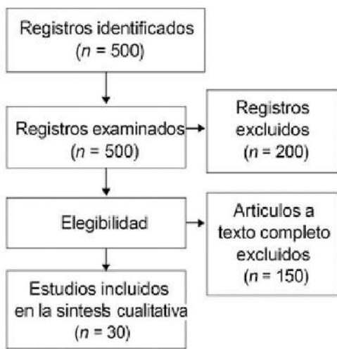
Figura 2: Diagrama PRISMA en el ejemplo aplicado.

PRISMA asegura que la revisión sea rigurosa, transparente y reproducible , mostrando claramente cómo se seleccionaron y analizaron los estudios. El diagrama PRISMA (figura 2) adaptado a educación muestra el flujo de selección de artículos en una revisión sistemática sobre metodologías activas en educación superior. Permite visualizar de manera clara y transparente cómo se depuró la información hasta llegar a los estudios relevantes.