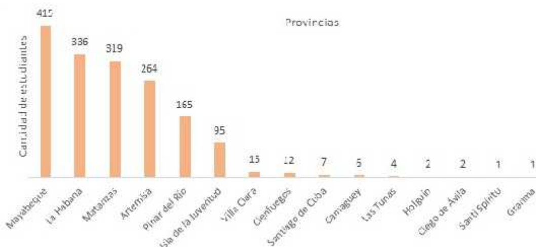
Figura 1. Total de estudiantes por provincias en la residencia estudiantil de la Cujae.

Las principales problemáticas que se presentan en el área vienen dadas por el incumplimiento de los deberes del becado, que trae consigo: el no cumplimiento de deberes comunitarios como la guardia estudiantil, la falta de sistematicidad en la limpieza de cuartos y áreas exteriores de los edificios, el uso de equipos no autorizados y música a alto volumen y en horarios no permitidos, desaprovechamiento y baja dedicación al estudio, alto consumo de cigarro y bebidas alcohólicas y poco aprovechamiento del tiempo libre de manera culta y sana. Por consiguiente, la permanencia de estas problemáticas afecta el correcto funcionamiento de la residencia estudiantil, incidiendo desfavorablemente en el cumplimiento de la misión del área, en particular, en la formación integral de los estudiantes becados. De acuerdo con [12], el proceso que ocurre en la residencia estudiantil, puede convertirse en enajenante para el estudiante, si este lo acoge como un lugar de paso y no como un espacio para su formación.