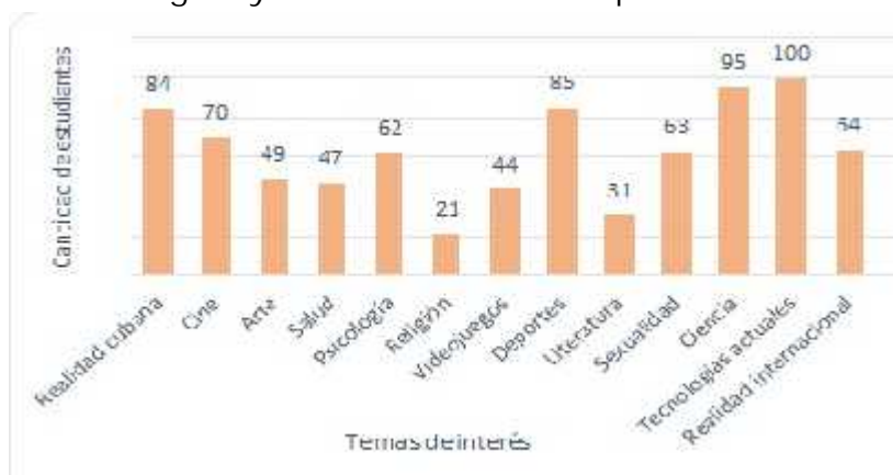
Figura 4. Temas a considerar para la realización de un debate. Elaboración propia.

En cuanto a los temas de interés, como se observa en la figura 4, si se creara un espacio para debates, dentro de los temas que más predominan para ser discutidos estuvieron: tecnologías actuales, ciencia y realidad cubana, siendo los temas religión y literatura los menos preferidos.