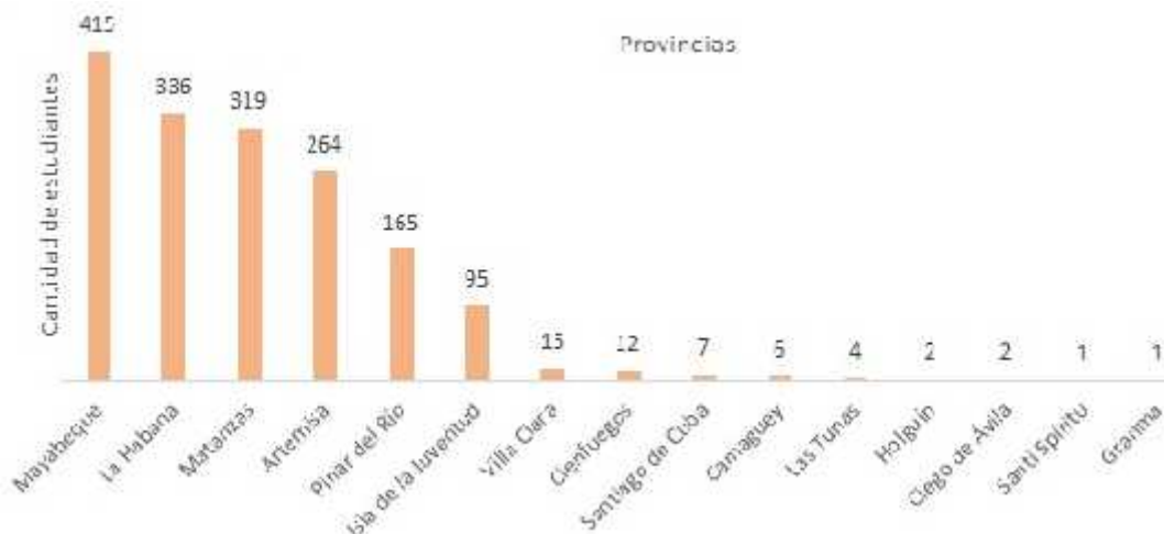
Figura 1. Total de estudiantes por provincias en la residencia estudiantil de la Cujae.

Las principales problemáticas que se presentan en el área vienen dadas por el incumplimiento de los deberes del becado, que trae consigo: el no cumplimiento de deberes comunitarios como la guardia estudiantil, la falta de sistematicidad en la limpieza de cuartos y áreas exteriores de los edificios, el uso de equipos no autorizados y música a alto volumen y en horarios no permitidos, desaprovechamiento y baja dedicación al estudio, alto consumo de cigarro y bebidas alcohólicas y poco aprovechamiento del tiempo libre de manera culta y sana. Por consiguiente, la permanencia de estas problemáticas afecta el correcto funcionamiento de la residencia estudiantil, incidiendo desfavorablemente en el cumplimiento de la misión del área, en particular, en la formación integral de los estudiantes becados. De acuerdo con [12], el proceso que ocurre en la residencia estudiantil, puede convertirse en enajenante para el estudiante, si este lo acoge como un lugar de paso y no como un espacio para su formación.