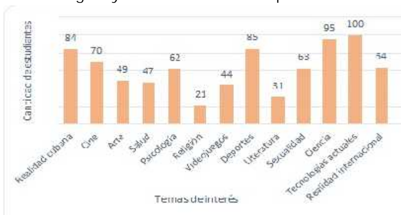
Figura 4. Temas a considerar para la realización de un debate. Elaboración propia.

En cuanto a los temas de interés, como se observa en la figura 4, si se creara un espacio para debates, dentro de los temas que más predominan para ser discutidos estuvieron: tecnologías actuales, ciencia y realidad cubana, siendo los temas religión y literatura los menos preferidos.