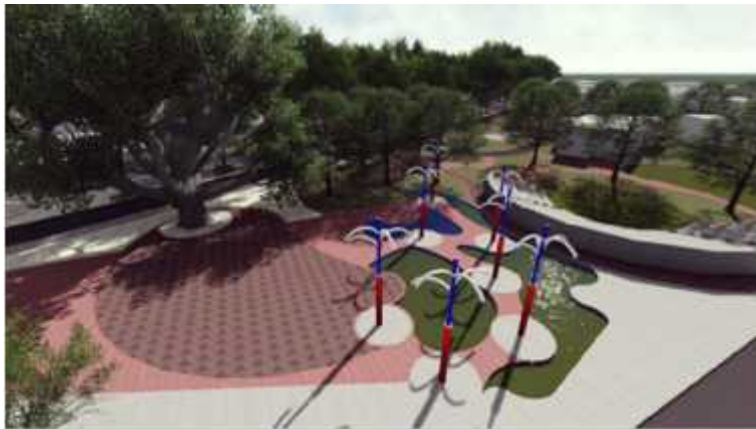
Figura 6.- Propuesta de Plaza y Monumentos a los Mártires de La Lisa. Equipo 2.