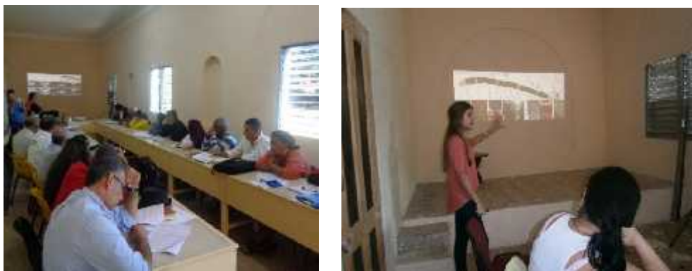
Figuras 3 y 4.- Presentación de las propuestas de diseño en el CAM Municipal de La Lisa.

La Academia no puede estar ajena a estas políticas, por lo que la formación del conocimiento tiene que estar en línea con los cambios que se producen sistemáticamente en la sociedad, de modo que puedan servir de intérpretes adecuados en los nuevos diálogos que necesariamente se establecen.