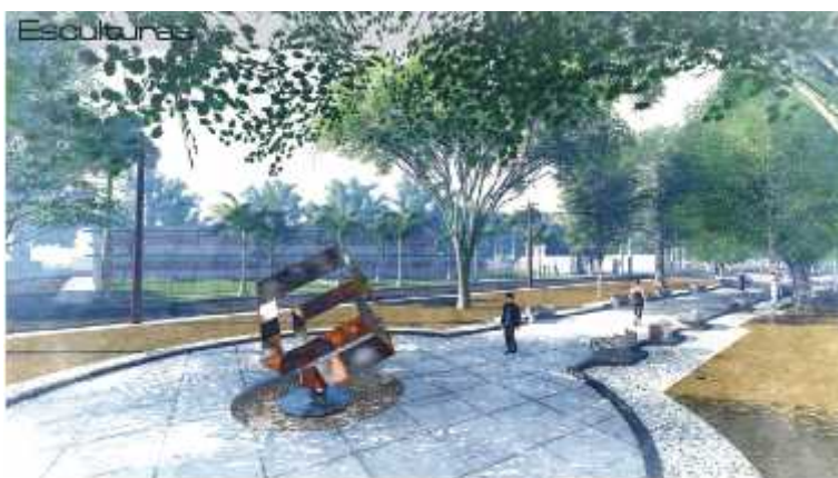
Figura 7.- Inclusión de esculturas monumentales. Equipo 3.