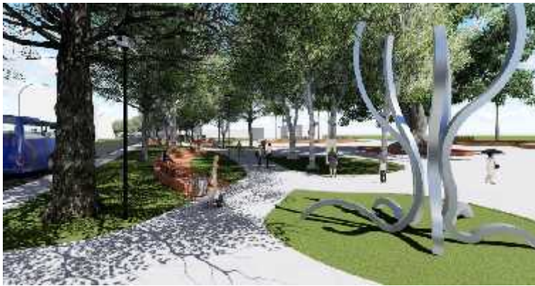
Figura 5.- Propuesta de recorrido. Equipo 1