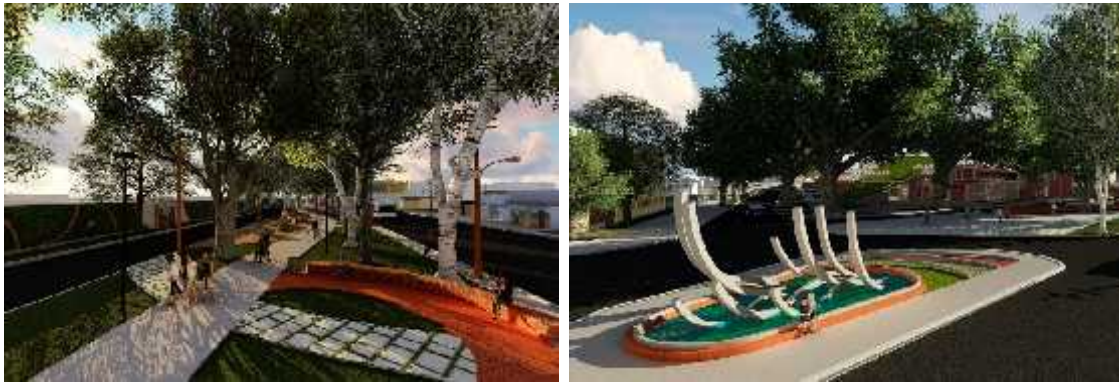
Figuras 8 y 9.- Propuesta definitiva de diseño para el de Paseo peatonal de la Avenida 51.