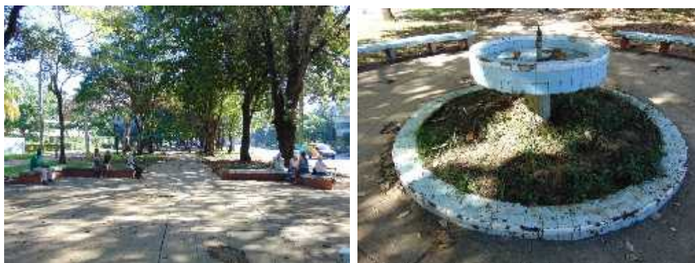
Figuras 1 y 2.- Vistas actuales del Paseo Peatonal de 51, La Lisa.

de la UNAICC (Unión Nacional de Arquitectos de la Construcción de Cuba) y de la Facultad de Arquitectura para la consecución de este objetivo.