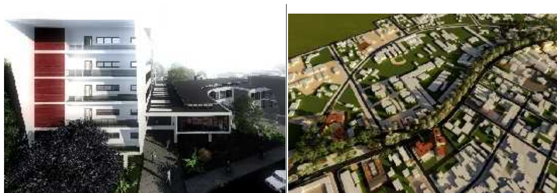
Figuras 12 y 13.- Propuesta de diseño para Viviendas y Centro Comercial (Ernesto del Valle) y vista superior del Paseo con los inmuebles recuperados.