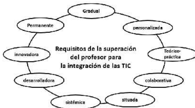
Figura 1: Requisitos de la superación del profesor para la integración de las TIC

El esquema de la figura 1, recoge las principales demandas a la superación del profesor para la integración de las TIC a su práctica profesional.