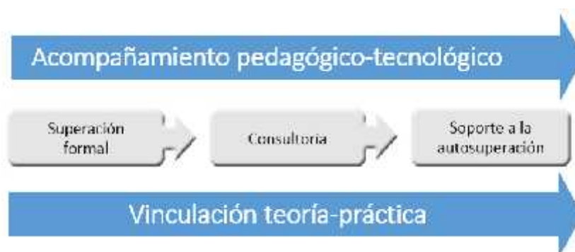
Figura 2: Tránsito del profesor de la dependencia a la independencia en su preparación para integrar las TIC en su práctica profesional.

“El acompañamiento pedagógico-tecnológico es un proceso sistemático y personalizado de asesoría al profesor llevado a cabo por las estructuras de soporte al proceso de integración de las TIC en una institución educativa” (4) (5). Se caracteriza por poseer carácter integral y multidimensional, por lo que aun cuando no posea el grado de estructuración o formalidad de otros tipos de superación ni se obtenga por recibirlo una certificación, el grado de satisfacción del profesor y el de efectividad obtenido tiende a ser superior, gracias a la atención personalizada y los lazos personales y profesionales establecidos durante el proceso.