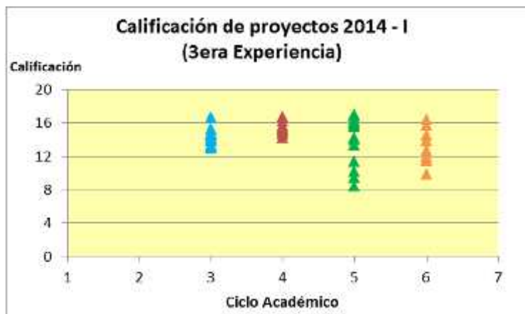
Figura 3. Resultados de proyectos 2014 – I.

En la figura 4 vemos un resultado uniforme, considerando que en todos los ciclos académicos hubo un buen desempeño y solo unos pocos no alcanzaron el nivel esperado.