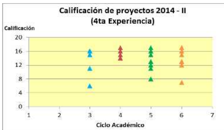
Figura 4. Resultados de proyectos 2014-II. Fuente propia

En la figura 4 vemos un resultado uniforme, considerando que en todos los ciclos académicos hubo un buen desempeño y solo unos pocos no alcanzaron el nivel esperado.